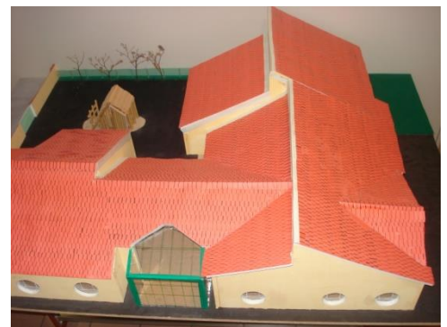
Maquette de l'école projet d'école 2011