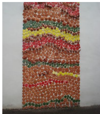
Frise sur mur Projet terre 2010 (avec centre argile)