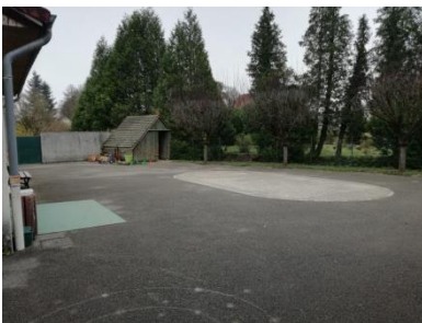
La cour des maternelles et CP