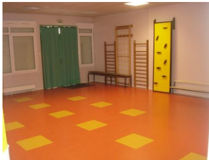
La salle de motricité