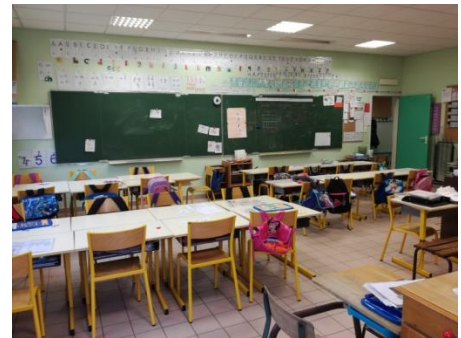
La classe des GS/CP