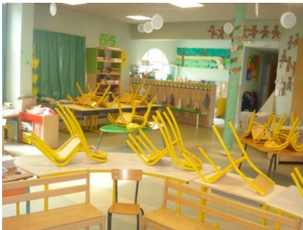
La classe des maternelles